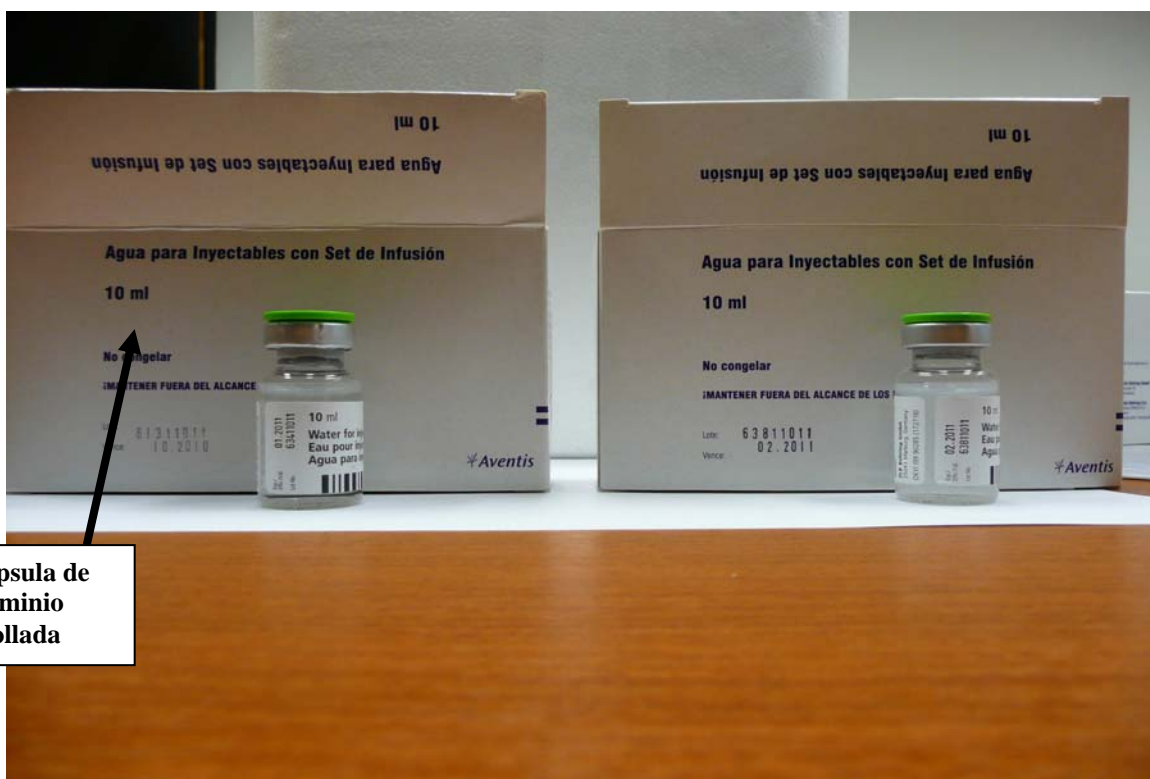
Capsula de aluminio abollada